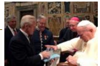
La asociación judía Pave the way fue recibida en Audiencia por el Papa.

CIUDAD DEL VATICANO, martes, 18 enero 2005 ( ZENIT.org ).- Juan Pablo II pidió que se refuerce el compromiso a favor del diálogo entre judíos y católicos al recibir este martes a un grupo de unos 160 rabinos y cantores de Israel, Europa y Estados Unidos.