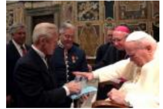
La asociación judía Pave the way fue recibida en Audiencia por el Papa.

CIUDAD DEL VATICANO, martes, 18 enero 2005 (ZENIT.org).- Juan Pablo II pidió que se refuerce el compromiso a favor del diálogo entre judíos y católicos al recibir este martes a un grupo de unos 160 rabinos y cantores de Israel, Europa y Estados Unidos.